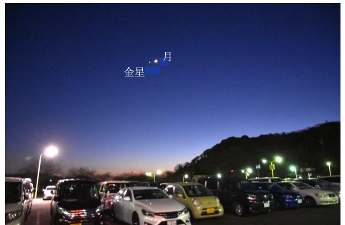
過去の月と金星が接近した夕暮れの様子

晴れた時には、夕焼けと一緒に見ることができますので、美しい風景として楽しむこともできます。ぜひ、チャレンジしてみてください。