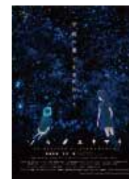
ご当地アニメ決定版 ソラユキサキ