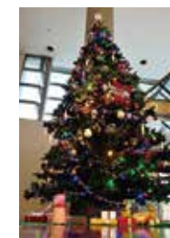
みんなで飾ろう! BIGクリスマスツリー