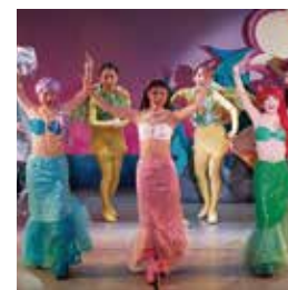
純真な愛の物語 ミュージカル「人魚姫」